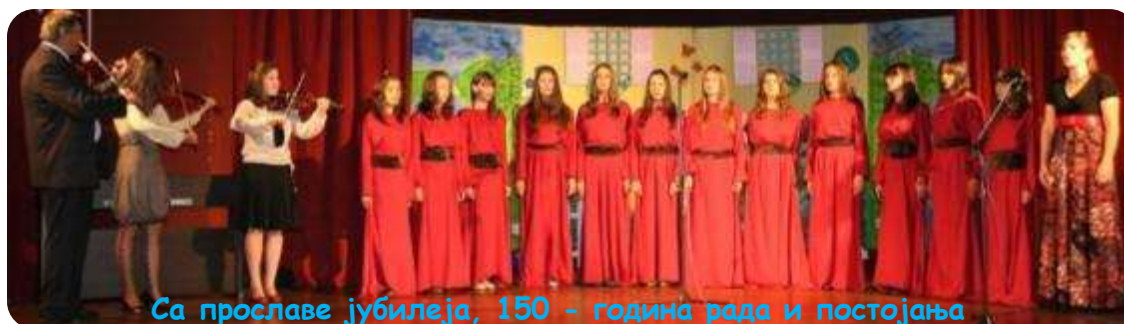
Са прославе јубилеја, 150 - година рада и постојања

1969. године школа у Мачкату добила је ВУКОВУ НАГРАДУ -признање које додељује Културно-просветна заједница Србије за значајне резултате на пољу образовања, науке и културе.