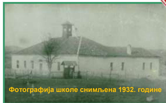
Фотографија школе снимљена 1932. године